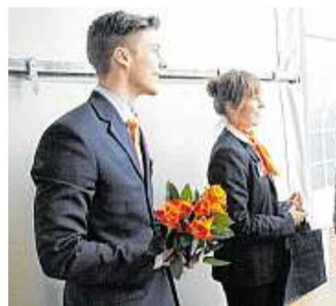
Volksbank-Mitarbeiter überreichten den Messegästen an den Eingängen zur Stadthalle Rosen.