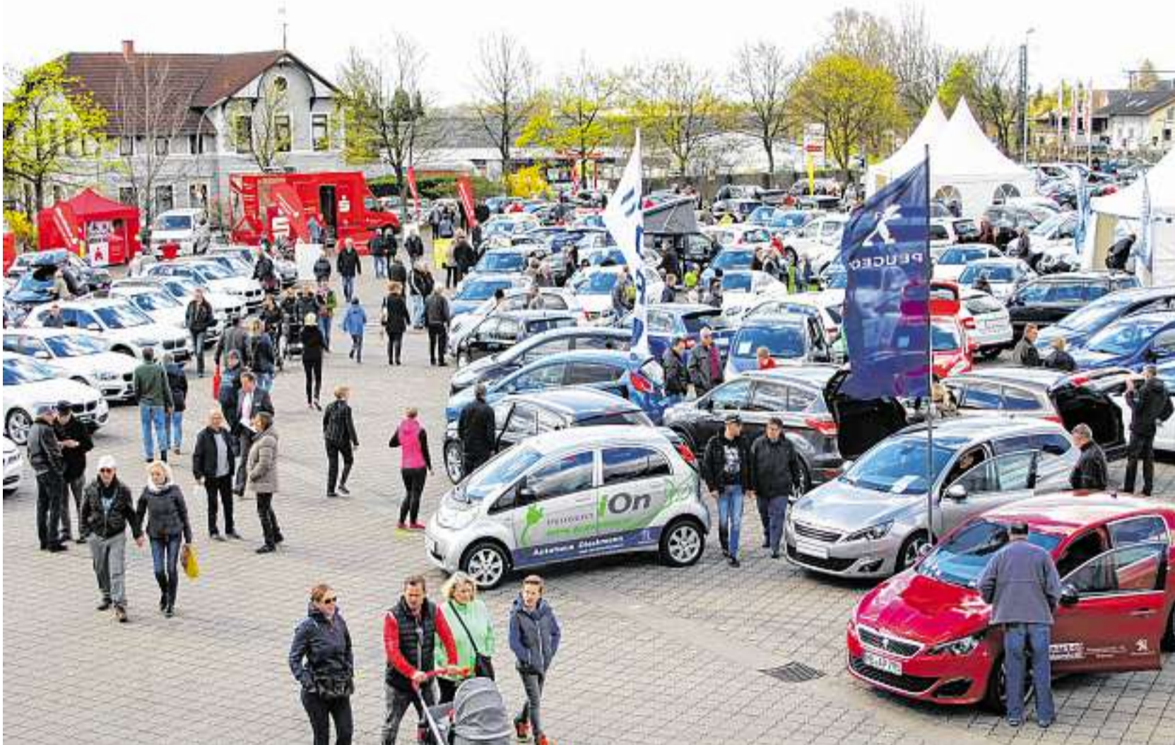
Auch am Sonntagmittag herrschte reges Treiben auf dem Freigelände an der Stadthalle Osterholz-Scharmbeck. Die Autohändler aus der Region hatten für Kaufinteressierte und Schaulustige insgesamt knapp 200 Autos vorgefahren.

Autobörse, Modernisierungsmesse und verkaufsoffener Sonntag bewegen die Osterholz-Scharmbecker