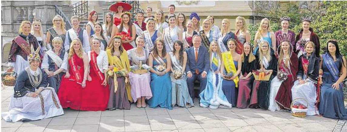
Auch Besuche beim Niedersächsischen Ministerpräsidenten Stephan Weil (Mitte) gehören zu den repräsentativen Aufgaben der Königin der Kräuterregion Wiesteniederung, die dabei wie auf diesem Bild auch mit zahlreichen anderen Majestäten aus ganz Deutschland zusammentritt.

Samtgemeinde Sottrum sucht neue Kräuterkönigin / Inthronisierung der Majestät im Juni in Horstedt