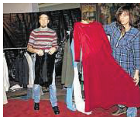
Szene aus dem Stück „Horizonte“ der „Neuen Bühne Beverstedt“. Die Premiere ist am 23. Februar.

Die Premiere des Stückes „Horizonte“ findet am Dienstag, 23. Februar, statt, weitere Aufführungen werden am 25., 26., 27. sowie 28. Februar stattfinden. Eintrittskarten sind in der Leselust sowie in der Postagentur in Beverstedt erhältlich. Ein Euro von jeder Eintrittskarte geht an den Verein „Refugi-um“